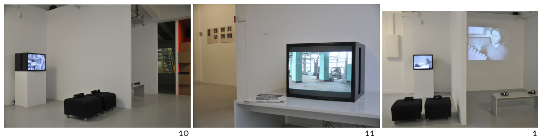
1-3 : images extraites du film FOR EXAMPLE, FABRIKA, 2010 ; 4-9 : images extraites du film KREENHOLM, 2009 ; 7 : Oleg Klushin in images extraites du film KREENHOLM, 2009 © Eléonore de Montesquiou, Romana Schmalisch 10-12 : vue de l'exposition, centre d'art passerelle, Brest - crédits photographiques : N. Ollier, 2010