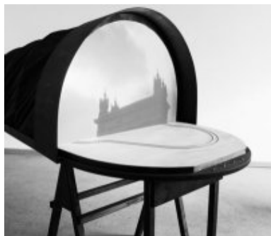
Romana Schmalisch, "Mobile Cinema", 2008 bois, tissu, projecteur, lecteur DVD, 138 x 95 x 245 cm

vendredi 05 novembre 2010, 19h tarif : 1,5€ / gratuit pour les adhérents