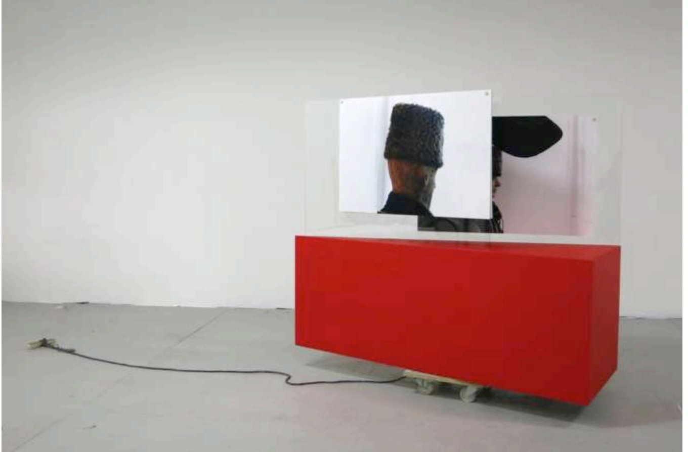
Florian Fouché, Têtes de paysan, décembre 2013, de l'ensemble « Le Musée Antidote » Bois, verre, photographies, aimants, peinture, corde, roulettes, 450 x 201 x 100 cm