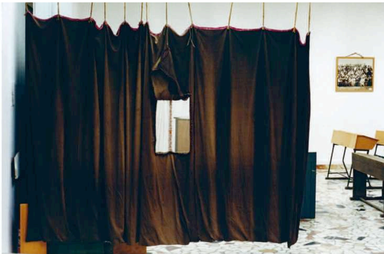
^ Derrière un rideau, une salle de classe reconstituée sert de lieu de conférence. v Florian Fouché, Le Musée antidote , « L'école du village », bois, verre, photographies, 103 x 34 x 65 cm.