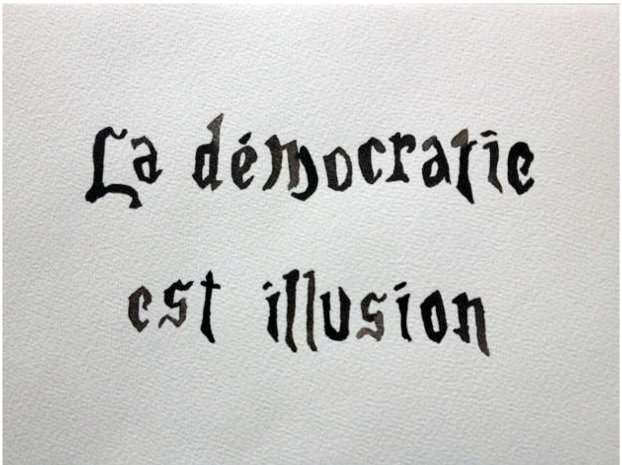
Goldschmied & Chiari, La démocratie est illusion, 2013 aquarelle 24x17cm