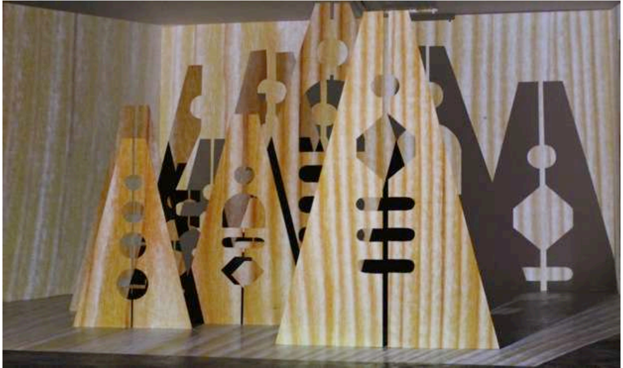
François Feutrie, vue de l'installation en cours de production pour l'exposition « Paysages d'intérieur », 2013 Passerelle Centre d'art contemporain, Brest