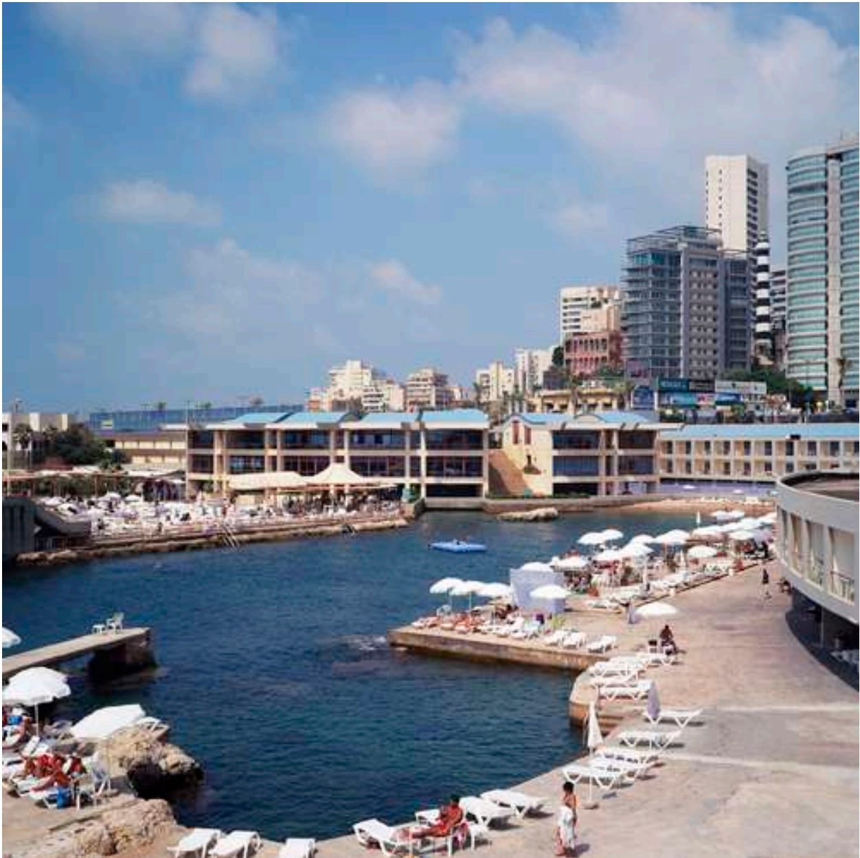
Tanya Traboulsi, extrait de la série Home , 2013