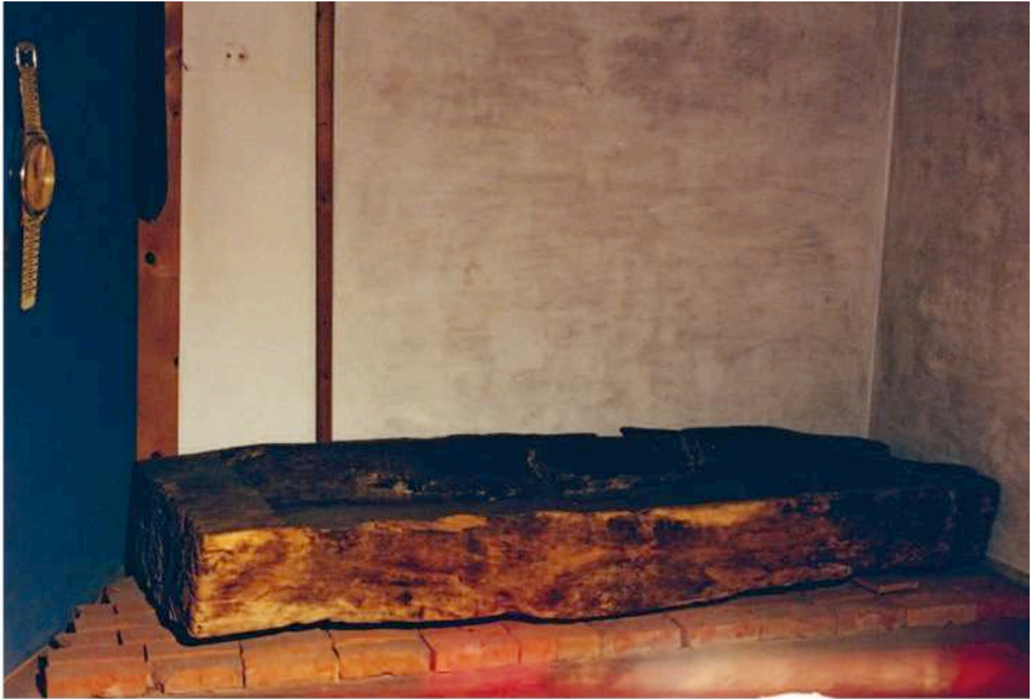
^ Salle « Temps ». « Nous avons cherché à représenter l'idée de mort assistée. » (Irina Nicolau) v Florian Fouché, Le Musée antidote , « Galerie d'art paysan » (détail), bois, verre, photographies, 133 x 34 x 65 cm.