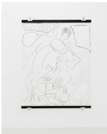
Seated Suspect on the Phone , 2016 Exposition "Coertregetour" Antoine Levi, Paris