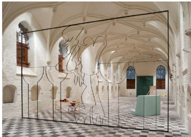
En Rachâchant , 2016 Vleeshal, Middleburg, 2015