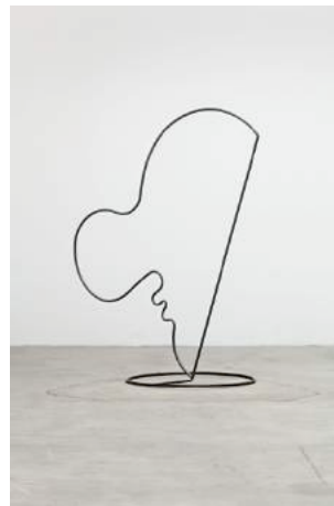
Untitled (Nose) , 2014