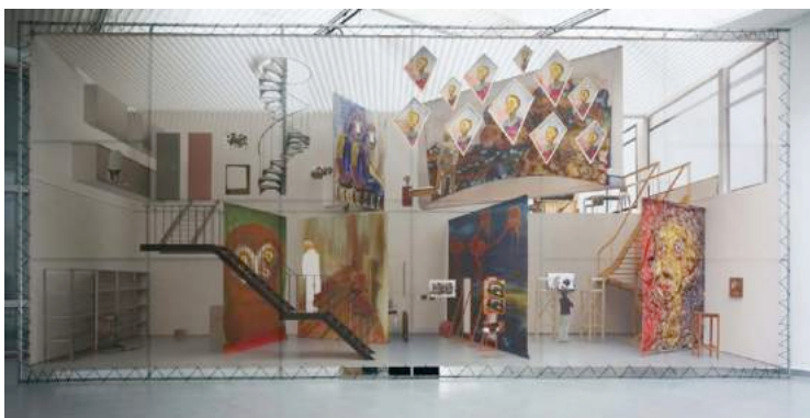
Ballast , 2014 CAC, Vilnius