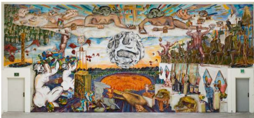
Konsensusbilde / Consensus Image , 2013 - 2015 Fresque murale - Oslo City Hall 595 x 1408cm