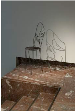
The Limp of A Letter (Face chair) , 2013 BOZAR, Brussels, 2015