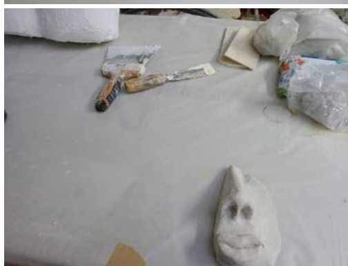
Les Chantiers-Résidence Vues d'atelier, 28 avril 2017