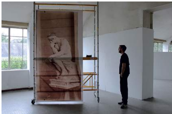
EESAB site de Rennes, 2015