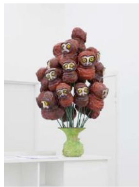
Owl Bouquet , 2016