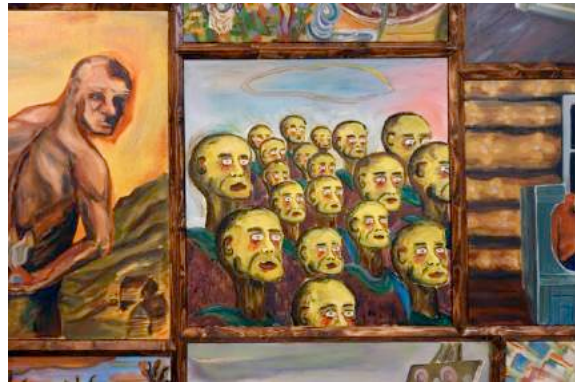
Les Origines moqueuses (Le scepticism du doute 01), 2016 (détails) La Loge, Bruxelles