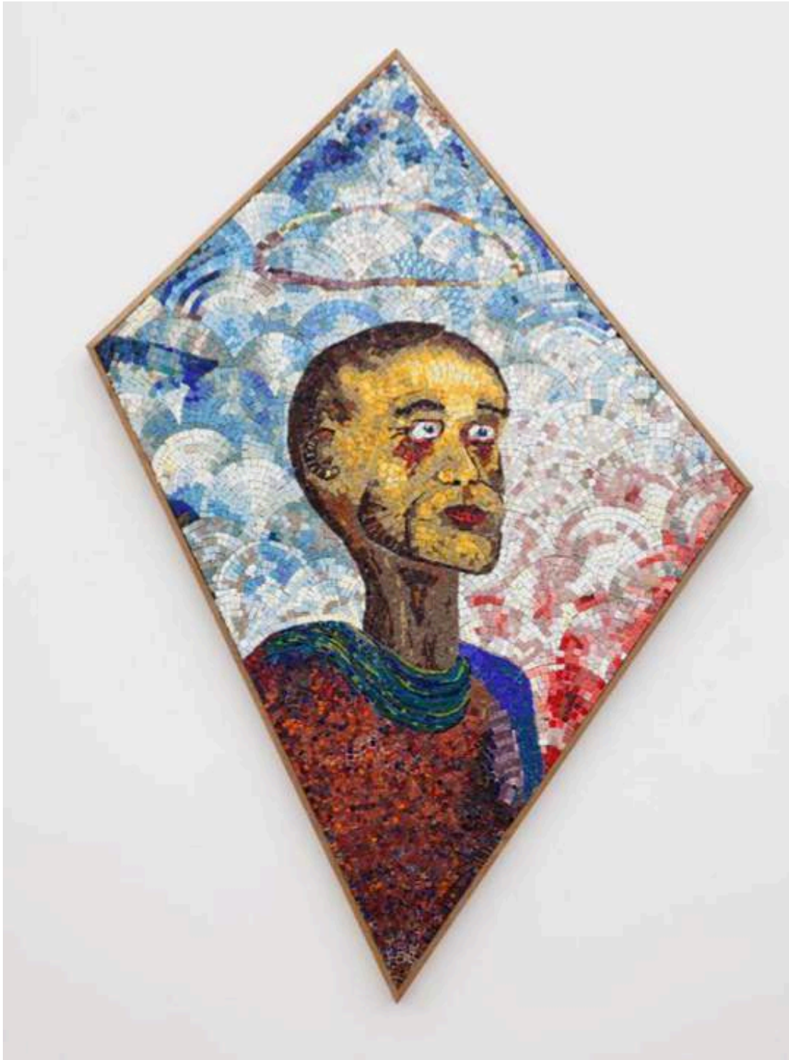
Steinar Haga Kristensen, Prophète malade , 2015 Mosaïque en verre 130 x 75 x 40cm