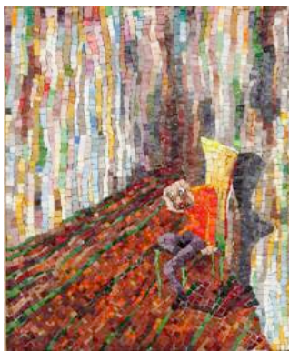
Angst Total , 2016