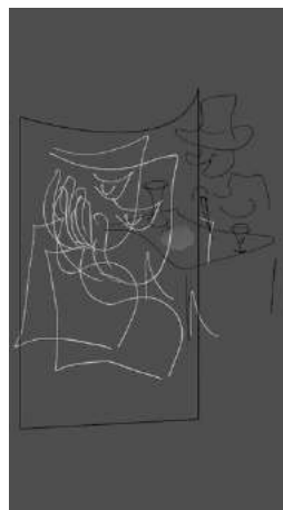
5a7 , 2015 Video 3 min.